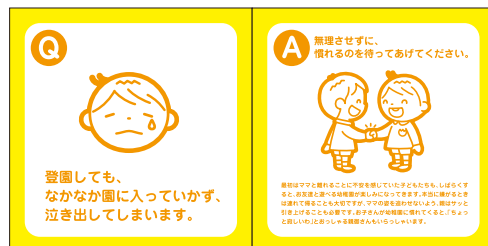
コンセプトブック(8ページ)

子どもを初めて幼稚園に通わせる保護者の方は、期待と不安をお持ちです。入園時に、疑問や心配事、もしものときのQ&Aをまとめたコンセプトブックをお渡しすることで、不安を取り除きます。また、そのようなツールを用意しておくだけで、園に対する信用もアップすることができます。